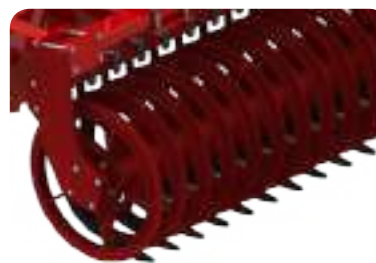
Rouleau à anneaux T ou U 520 mm (160kg/m)

Ses anneaux agressifs en forme de V sont idéaux pour émietter et affiner la terre, tout en assurant une reconsolidation moyenne du sol. Non recommandé pour les sols pierreux. S'adapte très bien aux conditions humides.