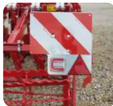
Signalisation routière sans fil et feux LED (option).