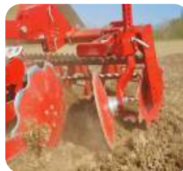
Disque de bord gauche pour fermer le sillon formé par le disque arrière gauche (option).