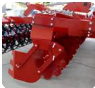
Déflecteurs latéraux avec parallélogramme