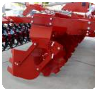
Déflecteurs latéraux à parallélogramme