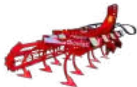
Déchaumeurs à Dents Vigne