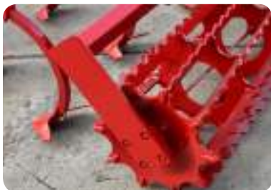
Rouleau à encoches 400 mm ou 520 mm (80/90kg/m)

Avec des lames crantées en acier à haute limite élastique (ALE), ce rouleau agressif nivelle le sol sans le compacter. Idéal en conditions sèches, il émiette parfaitement, brise les mottes et broyes les résidus végétaux en surface. Il n'est pas recommandé en conditions humides ou collantes.