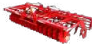
Déchaumeurs à Disques