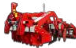
Déchaumeurs à Disques Vigne