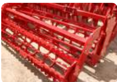
Rouleau Tandem barres 480 mm + rouleau crénelé 400 mm (150kg/m)

Idéal pour le travail du sol, même dans les terres légères ou déjà préparées, ce rouleau assure un bon émiettement et un conditionnement homogène du sol sans le compacter. Il fonctionne aussi bien en conditions sèches qu'humides. C'est le rouleau le plus simple et polyvalent.