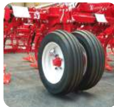
Roues avant jumelées 200/60 14.5".