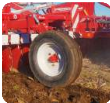
Roues avant 200/60 14.5".