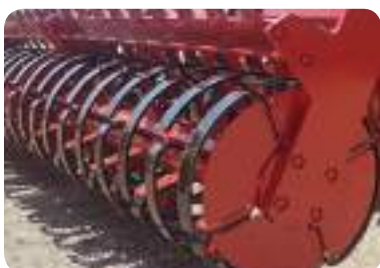
Rouleau à lames 520 mm (150kg/m)

Combine l'avantage du rouleau à barres, efficace pour le travail du sol, avec la capacité d'émiettement du rouleau crénelé. Idéal pour un broyage intensif, même dans des terres légères ou déjà préparées. Il assure une bonne reconsolidation du sol sans le compacter et fonctionne aussi bien en conditions sèches que légèrement humides.