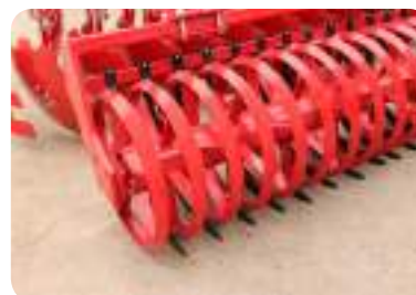
Rouleau V-Ring 600 mm (150 kg/m)

Rouleau spécialement conçu pour les sols lourds et collants. Idéal pour émietter les mottes et mélanger les résidus végétaux. Livré de série avec des racleurs intermédiaires réglables.