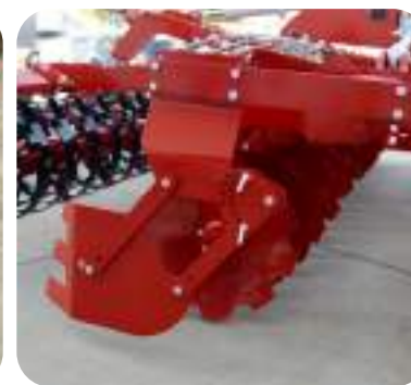
Défecteurs latéraux avec parallélogramme