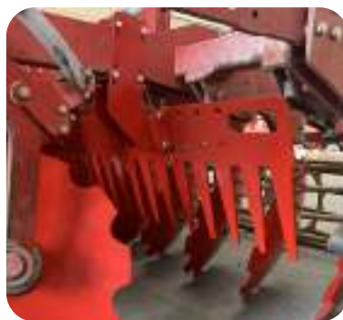
Peignes placés entre les rangées de disques ou entre les disques et le rouleau pour freiner le flux de terre et l'émietter (option).

* Selon le type de parcelle et la nature du sol.