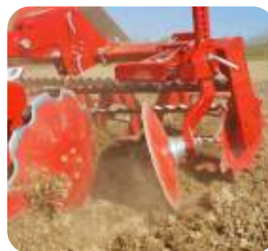
Disque de bord gauche pour fermer le sillon formé par le disque arrière gauche.