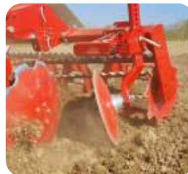
Disque de bord gauche pour fermer le sillon formé par le disque arrière gauche.