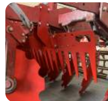
Peignes placés entre les rangées de disques ou entre les disques et le rouleau pour freiner le flux de terre et l'émettre (option).