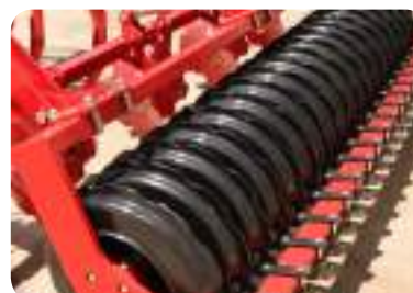
Rouleau à double disque profil 600 mm (200kg/m)

Rouleau relativement léger: Le profil en T est idéal pour émietter les mottes et les résidus végétaux. Il n'aplanit ni ne compacte le sol et convient aux sols peu argileux et limoneux. Le profil en U permet de travailler dans des sols plus collants, en se chargeant pour créer un contact terre/terre qui évite le bourrage. Livré de série avec des racleurs intermédiaires réglables.