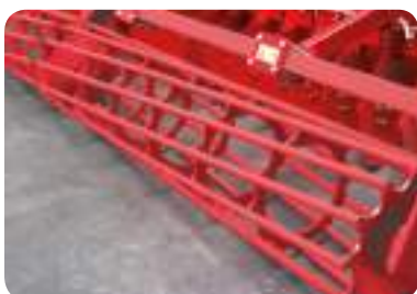
Rouleau à barres 480 ou 540 mm (80/90kg/m)

Avec des lames crantées en acier à haute limite élastique (ALE), ce rouleau agressif nivelle le sol sans le compacter. Idéal en conditions sèches, il émiette parfaitement, brise les mottes et broyes les résidus végétaux en surface. Il n'est pas recommandé en conditions humides ou collantes.