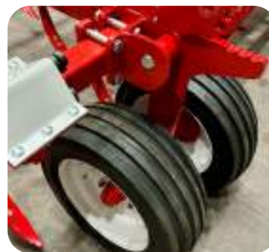
Roues avant jumelées 200/60 14.5" repliables hydrauliquement pour le transport (de série).