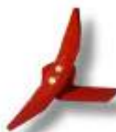
Ailette monobloc 288 x 6 mm.

Profondeur de travail de 7 à 25 cm. Idéal pour la fissuration en premier passage ou pour les travaux secondaires. Exerce très peu d'effort grâce à son angle de pénétration et à sa surface lisse et courbée autour de la dent.