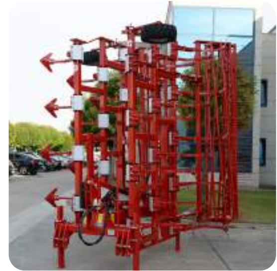
Faible encombrement au stockage.