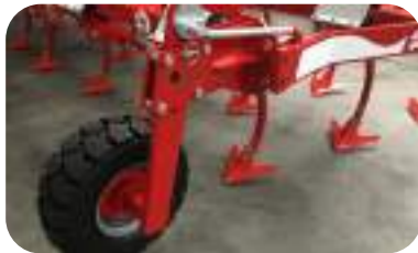
Roues avant 8" x 18,7 De série à partir de 21 / 22 dents.

Un bon contrôle de la profondeur de travail est essentiel, surtout pour les travaux superficiels de décompactage ou de faux-semis. C'est pourquoi il est primordial de définir les roues les plus adaptées en fonction des accessoires arrière (avec ou sans rouleau) et des conditions du sol.