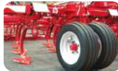
Roues jumelées avant 200/60 14,5" (de série sur le XLander-GC)

Idéales pour un travail en combinaison avec un rouleau afin d'obtenir une grande précision même à faible profondeur. Le design de la roue limite largement le bourrage en conditions humides.