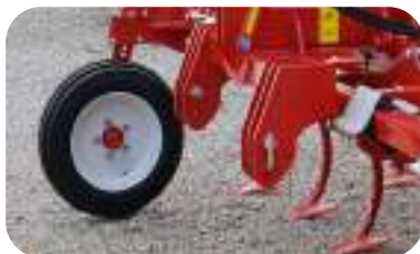
Roues avant 200/60 de 14,5" 10 PR (option)

Grâce à leur position latérale, elles sont particulièrement recommandées lorsque le XLander n'est pas équipé de rouleau.