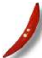
Soc réversible forgé 400 x 67 x 13 mm.

Profondeur de travail de 5 à 10 cm. Idéal pour la coupe superficielle des racines sans remuer la terre et pour préserver intacte la structure du sol ainsi que l'humidité en profondeur.