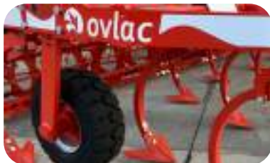
Roues latérales 8" x 18,7 (option)

Idéales pour le travail en combinaison avec un rouleau. Recommandées en zones sèches et pierreuses.