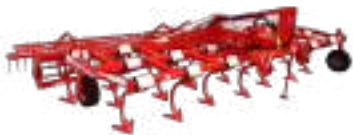
Déchaumeurs à Dents