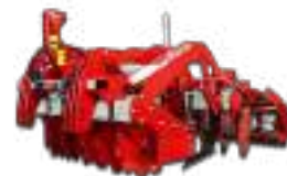
Déchaumeurs à Disques Vigne