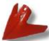
Soc Hirondelle forgé 288 x 6 mm.

Profondeur de travail de 7 à 20 cm. Idéal pour un premier passage sur chaume ainsi que pour les travaux de désherbage. Assure un mélange intensif de résidus végétaux et de terre.