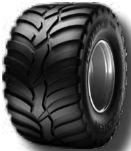
560/45 R 22.5"