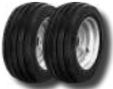
200/60 14.5 10 PR Jumelées