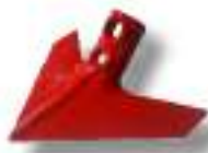
Soc superficiel forgé 275 x 6 mm.

Profondeur de travail de 7 à 20 cm. Idéal pour un premier passage sur chaume ainsi que pour les travaux de désherbage. Assure un mélange intensif de résidus végétaux et de terre.