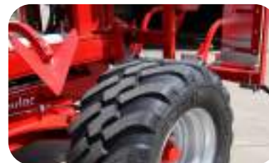
Roues 560/45 R 22,5" (de série sur le XLander-GC) y 600/40 22,5" (option)

Ces roues jumelées sont recommandées pour le travail des machines les plus larges, en combinaison avec un rouleau. Elles sont conseillées en terrains humides ou peu portants (deuxième passage, par exemple). Elles sont également montées de série sur les modèles GC.