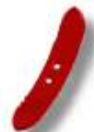
Soc réversible avec plaquettes en tungstène 360 x 60 x 20 mm.

Combinée à un soc réversible, l'ailette permet un travail superficiel de 5 à 8 cm tout en conservant une force de pénétration, même en sols secs, grâce à la pointe réversible qui maintient la dent dans le sol tout en fissurant la couche inférieure compactée.