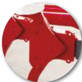
Sécurité à boulon: Mini-NF, Mini-SF