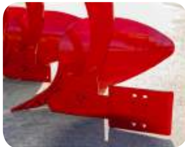
Talon. Rallonge de contrecep qui améliore la stabilité de la machine