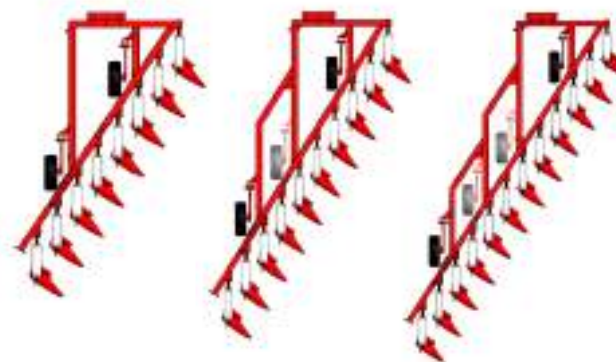
Vues d'en haut des Mini-6, Mini-8 y Mini-10. En grisée, la position de la roue arrière intérieure optionnelle au lieu de la roue extérieure de série

Tout comme sur la version réversible, la gamme de Mini à planche se compose en 3 bases : 6, 8 et 10 corps. Chacune de ces bases peut recevoir 1 ou 2 corps supplémentaires, soit fixes ou à repliage hydraulique pour réduire le porte à faux et la longueur de la charrue.