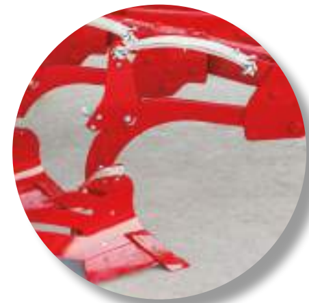
Détail du Corps Mini BF