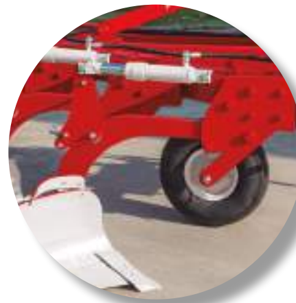
Détail du Corps Mini HF