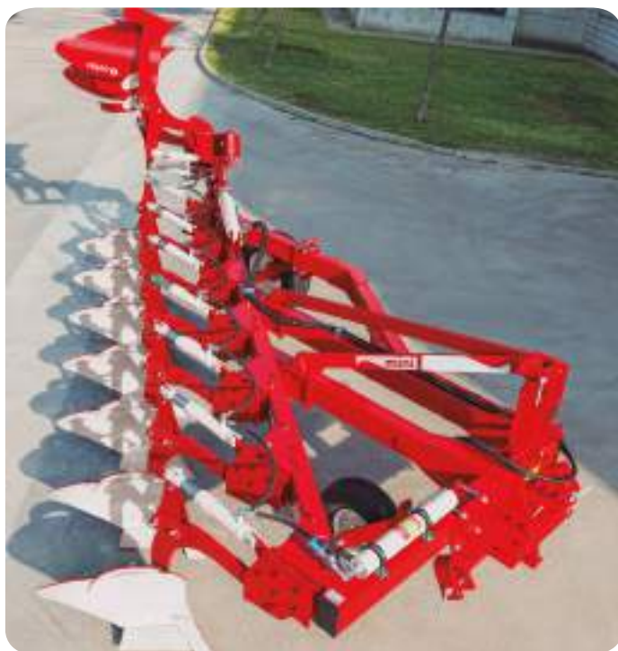
Mini HF 8+2

Tout comme sur la version réversible, la gamme de Mini à planche se compose en 3 bases : 6, 8 et 10 corps. Chacune de ces bases peut recevoir 1 ou 2 corps supplémentaires, soit fixes ou à repliage hydraulique pour réduire le porte à faux et la longueur de la charrue.