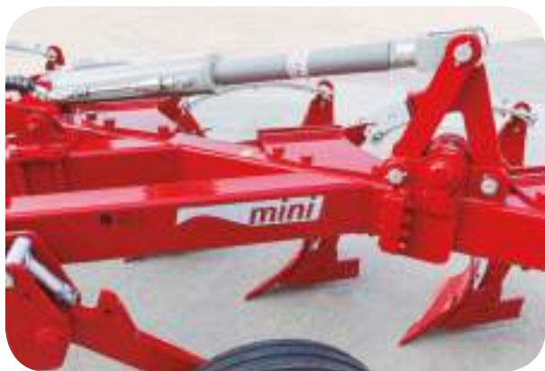
Repliage hydraulique des corps arrière optionnel pour réduire le poids durant le transport ou, encore, pour travailler au besoin avec moins de corps