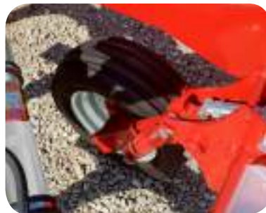
Roue de contrôle avant. Disponible en 6.00*9", 200/60, 250/65 (selon les modèles)