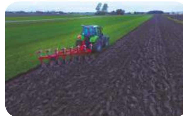
MINI NF 7+1 Pays-Bas