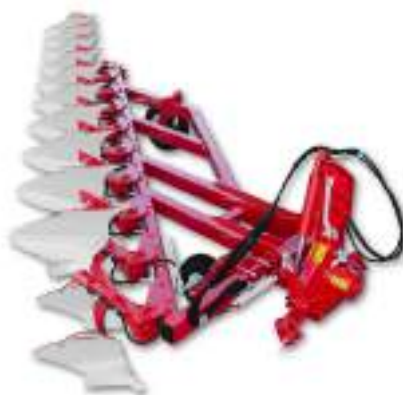
Mini réversible porté de 6 à 11 corps: Mini-NF/NH