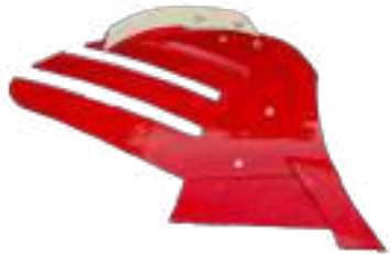
Versoir Claire-Voie pour les terres collantes. Déflecteurs qui améliorent l'enfouissement des débris