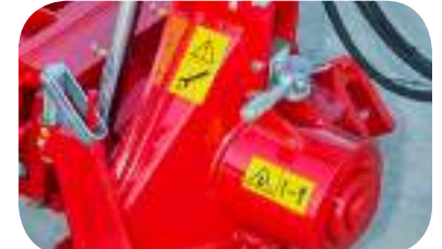
Blocage de tête pour le transport