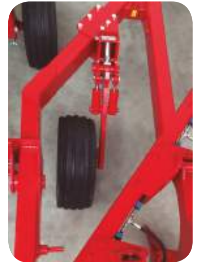
Roue de terrage intérieure (disponible sur Mini-N base 7 et 9)