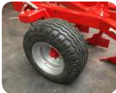
Roue pour le contrôle de profondeur et le transport arrière pour le contrôle et le transport. Très facile à utiliser, il suffit de changer la position d'un boulon. Il n'est pas nécessaire de bloquer les arrêts ou de libérer les amortisseurs.