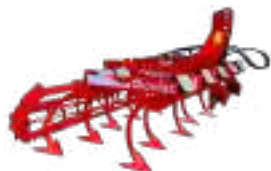
Déchaumeurs à Dents Vigne