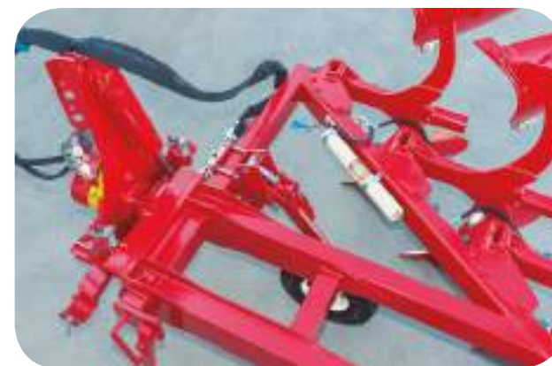
Détail de la partie avant