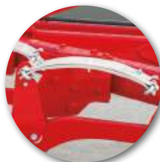
Sécurité Non-Stop à ressort à lames: Mini-BF