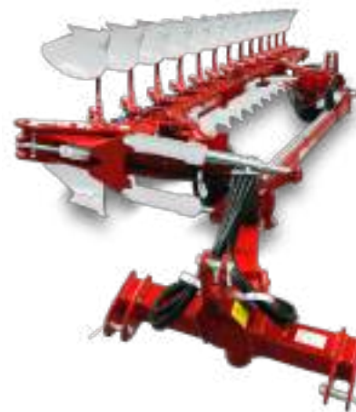
Mini réversible semi-porté de 12 à 13 corps: Mini-SF/SH