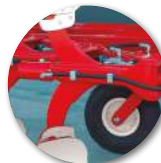
Sécurité Non-Stop hydraulique: Mini-HF, Mini-NH, Mini-SH