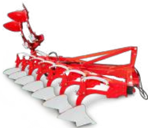
Mini planche porté de 6 à 12 corps: Mini-BF/HF