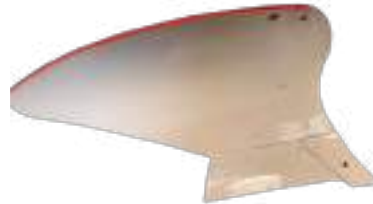
Soc forgé EcoFlow. Disponible en version courte ou longue