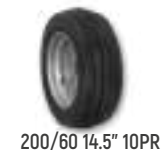
200/60 14.5" 10PR

**Disponible uniquement comme roue de contrôle.