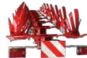
Kit de signalisation