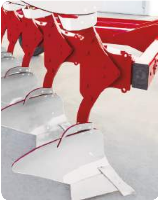
Détail du Corps de la Mini NF

La dernière version de la Mini réversible, la Mini-N , est disponible en sécurité boulon pour les zones de terres légères ou sans pierres ( Mini NF ). Sinon la version Non Stop hydraulique ( Mini NH ), permet de régler la pression de déclenchement en fonction des conditions du sol.