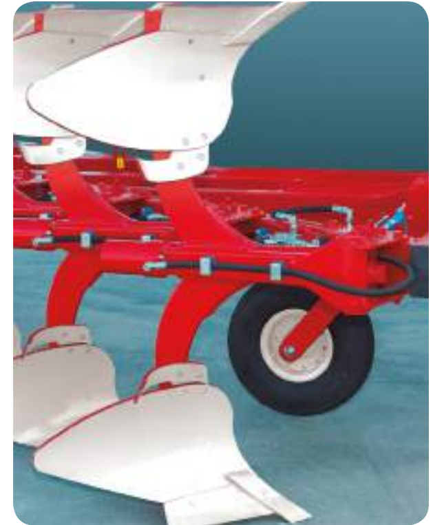
Détail du Corps de la Mini NH

La gamme Mini-N se compose de trois bases principales : 5, 7 et 9 corps, avec la possibilité d'y ajouter 1 ou 2 corps boulonnés au bâti principal de la charrue.