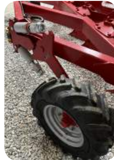
Roue de contrôle et transport hydraulique 280/70 R16