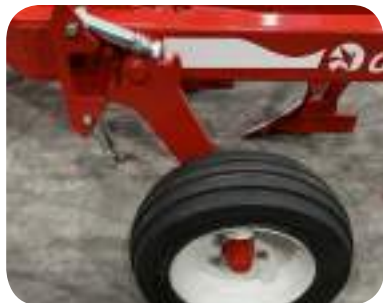
Roue de contrôle de profondeur. Disponible en 6.00*9", 200/60, 250/65, 340/55, 280/70 y 380/55