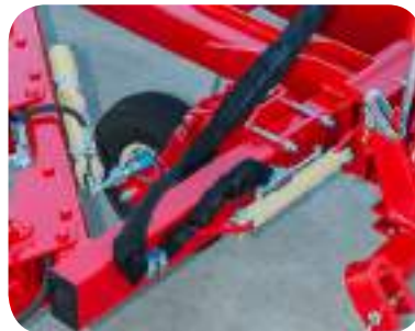
Déport hydraulique du 1er corps