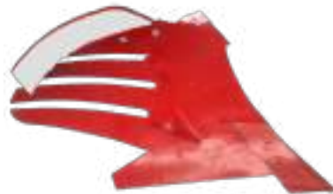
Soc long forgé 12 cm plus long que le standard