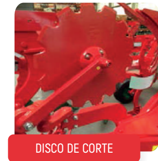
DISCO DE CORTE