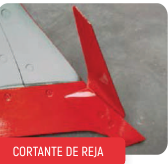
CORTANTE DE REJA

Todas las versiones de los semisuspendidos de Ovlac están disponibles además con anchura variable hidroneumática o por pasos de forma manual.