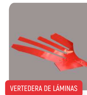
VERVEDERA DE LÁMINAS