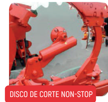
DISCO DE CORTE NON-STOP