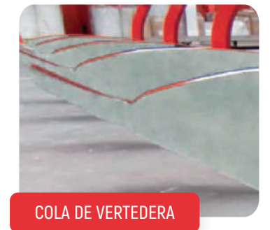
COLA DE VERVEDERA