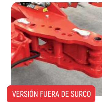
VERSIÓN FUERA DE SURCO